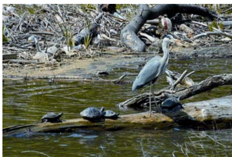
„Intakte“ Natur: Neuzeitlicher Müll mit Neozoen ( Trachemys scripta ssp.) - doch der Graureiher ( Ardea cinerea) hält die Stellung. Wienerwaldsee, 7. 5. 2008