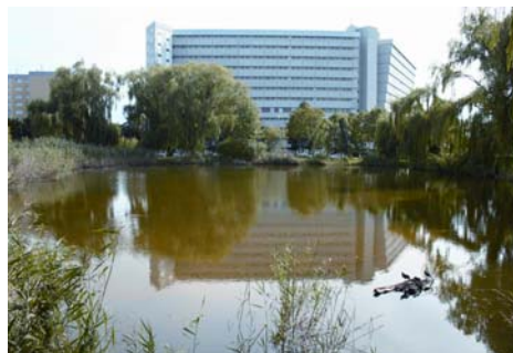
Eines von vielen Wiener Gewässern, in denen faunenfremde Wasserschildkröten zu finden sind. Rechts im Vordergrund Trachemys scripta ssp. mit jungen Teichhühnern ( Gallinula chloropus). Volkspark (Wien, Favoriten), 8. 8. 2008