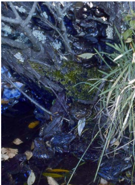
Der Froschstapel auf dem Baum. Im Wasser herum haben sich die anderen Tiere versammelt

Körperkontakt der Tiere. Die meisten waren auf einem dicht über dem Wasser hängenden Ast hochgeklettert. Dort bildeten sie einen Haufen von übereinander gestapelten Körpern (Männchen und Weibchen), der 7 - 8 Körperschichten hoch war. Die Tiere, die auf dem Ast keinen Platz mehr gefunden hatten, bildeten weitere kleinere Körperhaufen in der näheren Umgebung des Baumes.