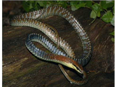
Dendrelaphis kopsteini VOGEL & VAN ROOIJEN, 2007, West-Malaysia.

Im Alter von nur 46 Jahren verstarb er am 14. April 1939 in Den Haag (ADLER 1989). Weitere biographische Angaben folgen in einer Übersicht am Ende des Beitrages.